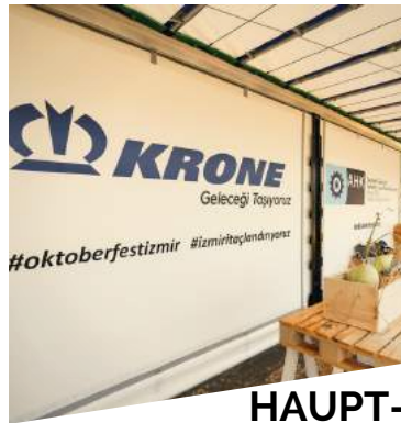
HAUPT-SPONSOR 2 SPONSOREN