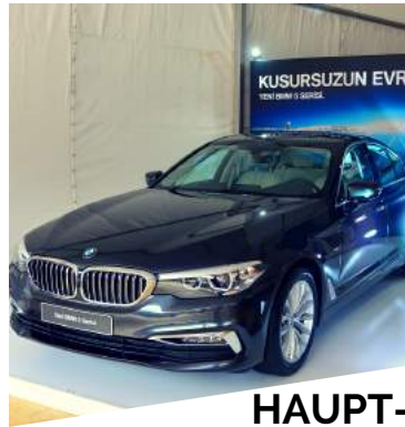
HAUPT-SPONSOR 2 SPONSOREN